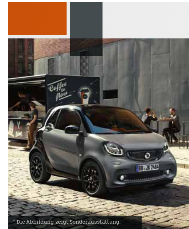
* Die Abbildung zeigt Sonderausstattung.