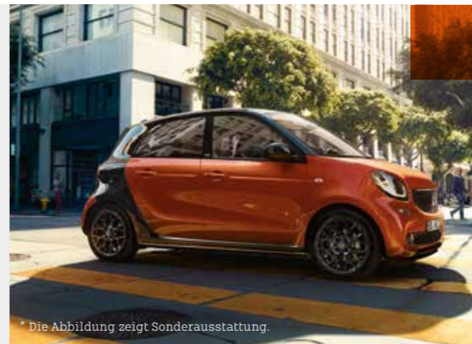
* Die Abbildung zeigt Sonderausstattung.

1 Ein Leasingbeispiel der Mercedes-Benz Leasing GmbH, Siemensstraße 7, 70469 Stuttgart. Stand 01.04.2016. Ist der Darlehens-/Leasingnehmer Verbraucher, besteht nach Vertragsschluss ein gesetzliches Widerrufsrecht nach § 495 BGB. 2 Kraftstoffverbrauch (l/100 km): innerorts 4,7/außerorts 3,7/kombiniert 4,1. CO 2 -Emissionen (kombiniert): 94 g/km, Effizienzklasse: B. 3 Kraftstoffverbrauch (l/100 km): innerorts 5,0/außerorts 3,6/kombiniert 4,2. CO 2 -Emissionen (kombiniert): 96 g/km, Effizienzklasse: B. 4 Unverbindliche Preisempfehlung des Herstellers, zzgl. lokaler Überführungskosten.